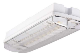
ORION LED 100